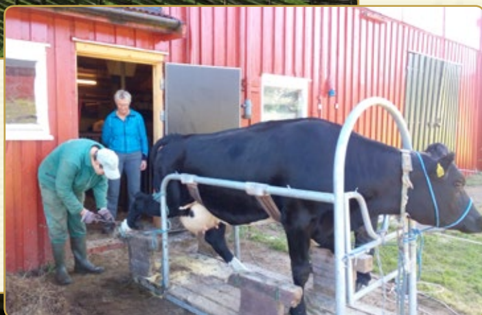
... a každodenní praxe