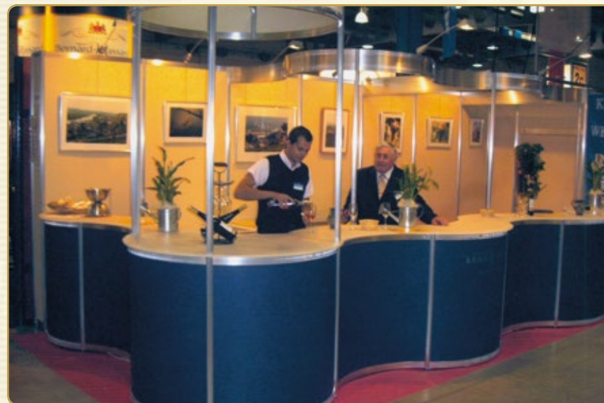
Součástí praxe byla nejen výroba vína ale také jeho servírování