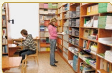
Školní studijní a informační centrum