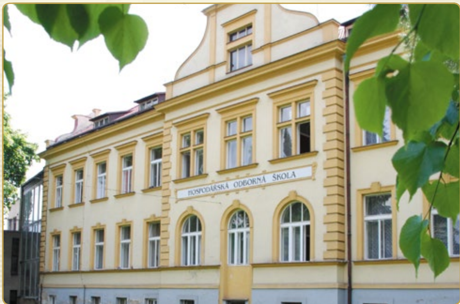
Historická budova školy