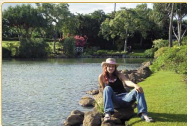
Nikdy nevíte, jaká dobrodružství vás čekají...

Práce spočívala v krmení všech zvířat a starání se o koně – krmení, čištění, sedláni, mytí a asistence veterinářům. Později cvičení mladých koní a asistence při cvičení závodních koní. Jak je zvykem na ranči bývá dost práce, a tak se pracovalo od pondělí do neděle, ale my měly v pátek volno. Toto volno jsme využily k poznání všech krás celého ostrova. Na této praxi jsme se naučily nový styl ježdění a vše s ním spojené – western.